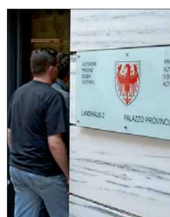
50.000 öffentlich Bedienstete warten auf den neuen Vertrag.

teil der Gewerkschafts-Vorschläge „zur Verbesserung des Entwurfes“ abgelehnt worden. Sie hatten u.a. die Bestimmungen über die Mutter- und Vaterschaft, einige wirtschaftliche Aspekte wie die Zweisprachigkeitszulage und die Häufung von Aufgabenzulagen sowie die Anerkennung einer vorangegangenen Berufserfahrung betroffen. Gerade Letzteres sei für die Attraktivität der Stellen im öffentlichen Dienst von enormer Bedeutung, die gerade unter den niedrigen Löhnen leide. Die Gewerkschaften beklagen auch, dass im Rahmen der Regelung zu den Elternzeiten gesamtstaatliche Bestimmungen, wie zum Beispiel die Fristen für die Vorankündigung, nicht angenommen würden. „Mehrere Verzögerungen und Verschiebungen von Verhandlungsterminen erlauben es nicht,