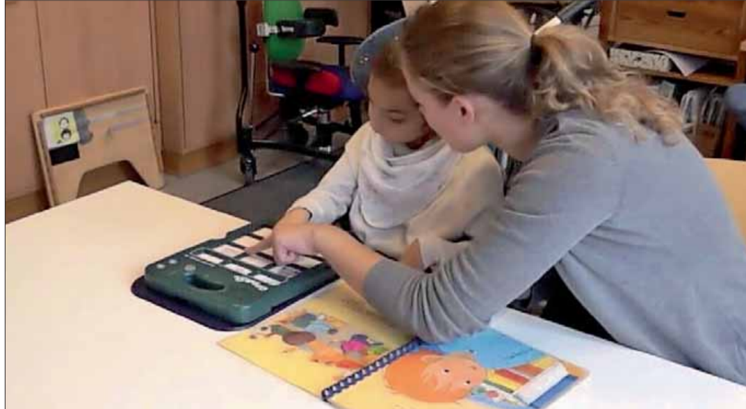
Immer zu wenig: Integrationslehrer und Mitarbeiter für Integration.